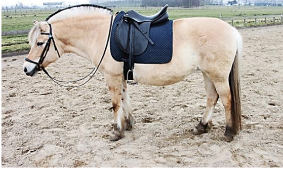
Een correct opgezadeld paard.

Om op te zadelen leg je eerst het zadel over je linkerarm en loop je naar de linkerkant van het paard. Je tilt dan het zadel over de rug heen en legt het zo neer dat het zadel iets op de schoft ligt. Leg uiteraard wel zachtjes het zadel neer zodat je paard niet schrikt. Als het zadel ligt dan trek je het een beetje naar achteren zodat de haren onder het